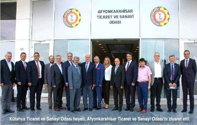
Kütahya Ticaret ve Sanayi Odası heyeti, Afyonkarahisar Ticaret ve Sanayi Odası'nı ziyaret etti.