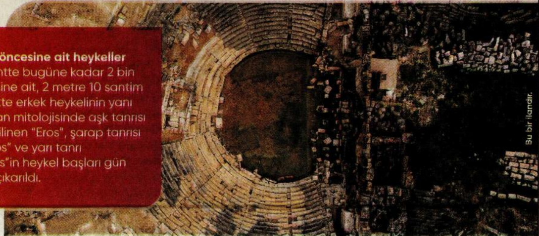
Bu bir ilandır.

Antik kentte bugüne kadar 2 bin yıl öncesine ait, 2 metre 10 santim yükseklikte erkek heykelinin yanı sıra Yunan mitolojisinde aşk tanrısı olarak bilinen "Eros", şarap tanrısı "Dionysos" ve yarı tanrı "Herakles" in heykel başları gün yüzüne çıkarıldı.