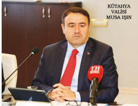
KÜTAHYA VALİSİ MUSA İŞIN

İşin, Kütahya'nın sanayi şehri olduğunu söyledi. Sanayide kaydedilen yüzde 10,4'lük kalkınma ile Kütahya'nın önemli bir ilerleme kaydettiğini belirten Vali Işın, "Kütahya, 2001-2021 yılları arasında, sanayi sektöründe yüzde 10,4'lük bir kalkınma gerçekleştirerek Türkiye genelinde 7 basamak birden yükselmiş ve 31'inci sıraya gelmiştir. Bu önemli bir ilerlemedir. Gayri-safi Yurt İçi Hasıla'nın (GSYH) yüzde 29'u sanayi sektöründen, yüzde 26'sı ise imalat sanayidir" ifadelerini kullandı.