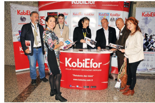
Etkinliğin tek basın ve medya hizmet sponsoru olan KobiEfor'un standı yoğun ilgi gördü.