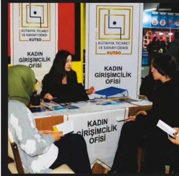
Kütahya Ticaret Ve Sanayi Odası'nın Kadın Girişimcilik Ofisi, Dumlupınar Üniversitesi'nde stant açarak kadın girişimcilere yön verdi.