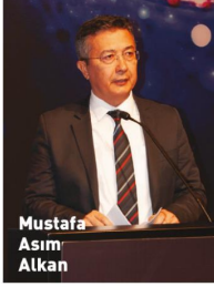
Mustafa Asım Alkan

Cumhuriyetimizin geçmişini irdeleyip geleceğe ışık tutmak amacını taşıyan KalDer'in 'Su Gibi' temasıyla düzenlediği bu etkinlikte emeği geçen herkesi tebrik eden İstanbul Vali Yardımcısı Mustafa Asım Alkan ; "Ülkemiz coğrafi açıdan tabiatı, iklimi, doğal zenginlikleri ve konumuyla öne çıkıyor. Bu güzel ülkenin korunması ve gelecek nesillere teslim edilmesi bizlere düşen en büyük görevlerden biridir. Doğrularımızın ve yanlışlarımızın objektif olarak mercek altında değerlendirilmesi, yanlışlardan ders çıkartılması, doğruların ciddi bir planlama ile çoğaltılarak devam ettirilebilmesi Türk toplumuna umut veren geleceği hazırlayacaktır" dedi. Alkan, Büyük Önder Gazi Mustafa Kemal Atatürk'ün kadına verdiği önemi anımsatarak, Cumhuriyet kadınlarına gereken desteği vereceklerini vurguladı.