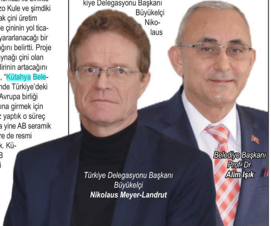
Türkiye Delegasyonu Başkanı Büyükelçi Nikolaus Meyer-Landrut

Meyer-Landrut, projenin hem sektörün hem de kent in ilerlemesine, gelişimine katkı sağlayacağına vurgu yaptı. DEVAMI 2'DE