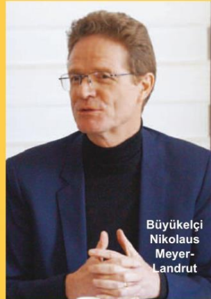
Büyükelçi Nikolaus Meyer- Landrut

cesinde de sektörün gelişimine katkıda bulunulmasını amaçlıyoruz. Üretim geliştiği zaman burada istihdamın ve gelirin artmasına da katkı sağlayacak. O sebepten dolayı bu Kütahya için önemli bir proje ama bizler için de önemli bir proje. Çünkü Avrupa Birliği'nin değer zincirine katkı sağlayacak. Biz aynı değerler zincirini paylaşıyoruz. Bu bakımdan da rekabetin ve rekabet gücünün artmasını arzu ediyoruz. Belediyemize, Sayın Belediye Başkanımıza ve tüm paydaşlara teşekkür ediyorum. İnanıyorum ki herkes bu projenin başarıyla sonuçlanmasını sağlayacak” dedi.