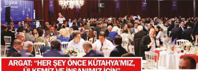
ARGAT: "HER ŞEY ÖNCE KÜTAHYA'MIZ, ÜLKEMİZ VE İNSANIMIZ İÇİN"

"140'TAN FAZLA ÜLKEYE İHRACATLA DÜNYA SOFRALARINDA YER ALIYORUZ"