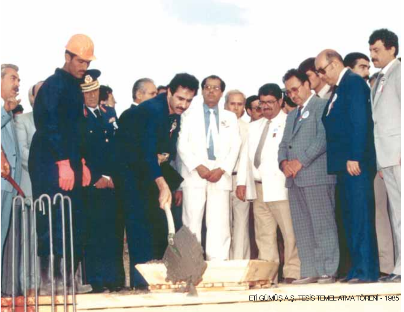
ETİ GÜMÜŐ A.Ő. TESİS TEMEL ATMA TÖRENİ - 1985