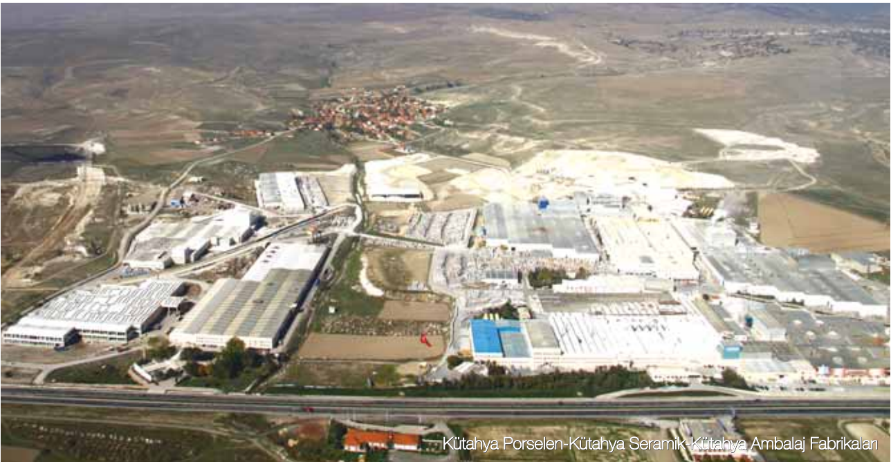
Kütahya Porselen-Kütahya Seramik-Kütahya Ambalaj Fabrikaları

1989 yılında kurulan Kütahya Seramik, adını medeniyetler köprüsü Anadolu'nun seramik baŐkenti Kütahya'dan almıŐtır.